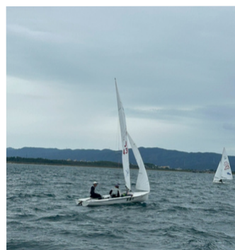
山崎・森本・吉田 4379

スナイプ級は初日、北風4～5mの中4レースを終えてインカレ本戦出場圏内である4位の富山大と31点差をつけられ7位で終える。